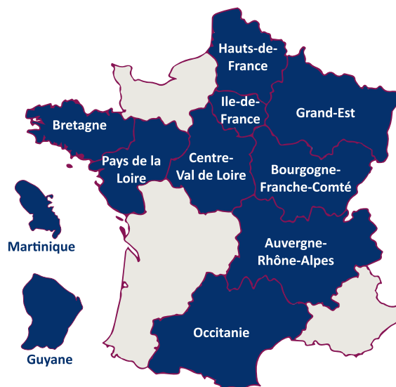
Carte des 11 CRCDC participants au Défi connecté Mars Bleu 2024